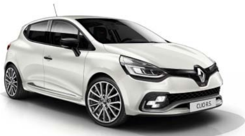
Alpu balta (NM)